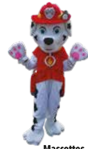
Mascottes Assistantes mat.